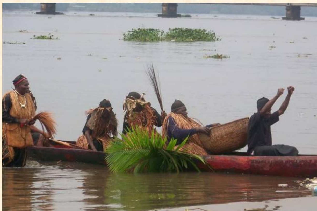
© Jean Paul MONGO BELL, 喀麦隆, 2022

恩贡多传统源于喀麦隆萨瓦社区对水神的崇拜。每年 9 月至 12 月，车队都会游览传统的萨瓦地区，举办表演、比赛、集市和选美比赛。十二月的第一个星期天，人们聚集在乌里河岸边，观看牧师从神圣的独木舟上潜入水中，以获取神谕的信息。该信息支配着社区生活，直到下一次庆祝活动为止。