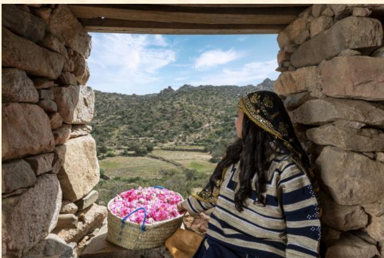
© Saleh Althobaiti / 遗产委员会, 沙特阿拉伯, 2021

在沙特阿拉伯的塔伊夫地区，玫瑰种植是社会和宗教仪式的重要组成部分，也是重要的收入来源。在三月开始的收获季节，农民和他们的家人在清晨采摘玫瑰，然后将它们运到当地市场出售或运到家里进行蒸馏。社区在美容产品、传统药物、食品和饮料中使用玫瑰水和精油。塔伊夫玫瑰和玫瑰水也作为礼物赠送。